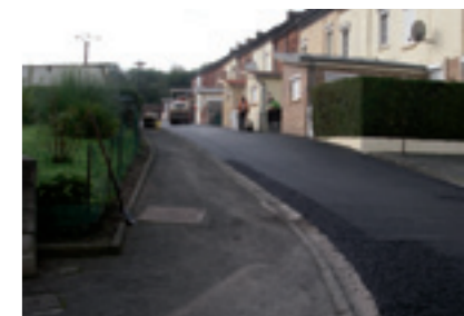
Travaux quartier de la Verrerie Noire