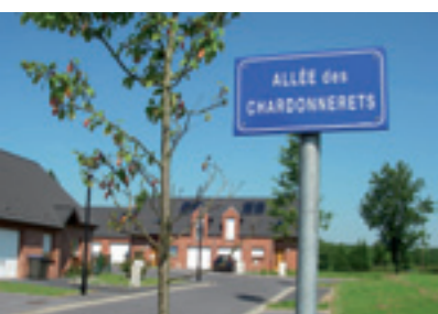
Résidence du Tissage