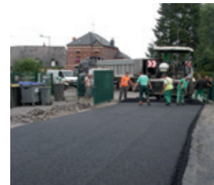
Entrée des services techniques rue Gabriel Péri