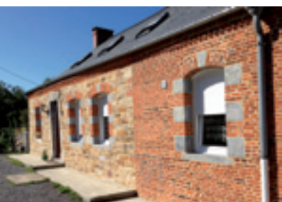
Une façade rénovée