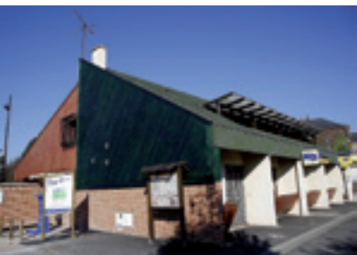
La Poste accueillera la Maison pluridisciplinaire de santé