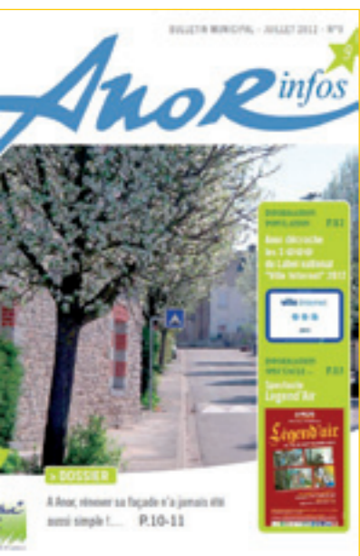
Le journal : un lien régulier