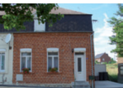
Une façade rénovée