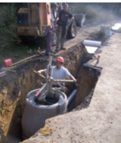
L'assainissement : un enjeu majeur