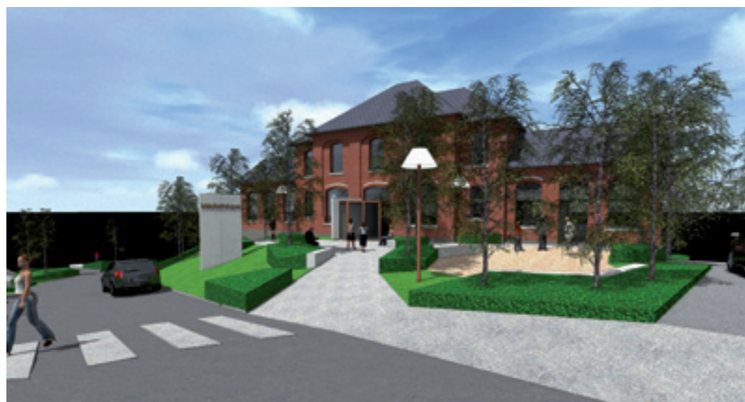
Projet de la future Médiathèque et des activités associées