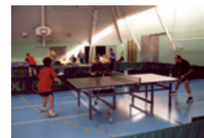
Compétition Tennis de table Handisport