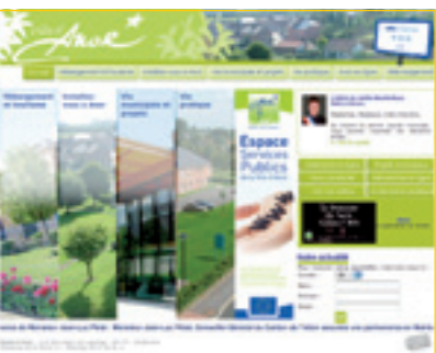
Le site internet d'Anor