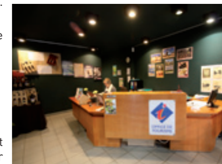
L'OTSI Pays de Fourmies Trélon, une compétence offensive

Sur le plan culturel, avec Trélon et Wignehies, nous avons créé « Légendes et Contes » débouchant sur des spectacles de qualité où l'habitant reste l'acteur premier... Une bien belle réussite également : « Scènes de Méninges ».