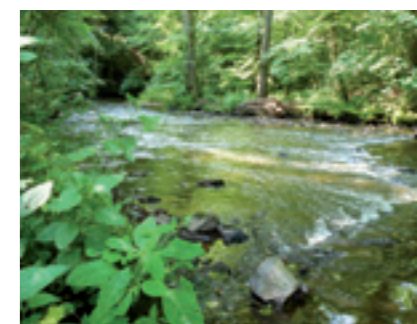
L'eau : une richesse