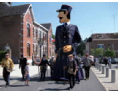
Le Gabelou, géant d'Anor