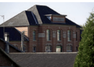
Ecole maternelle : un projet