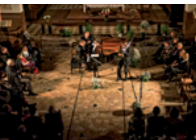
Concert Cuivres en Nord