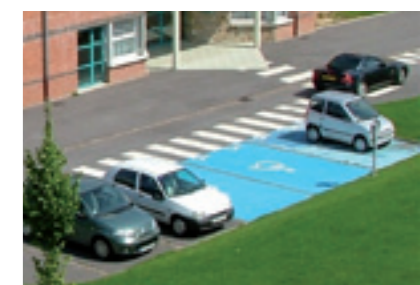
Clos des Forges : accessibilité