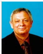
JL PERAT Président du Réseau des Ruches Député du Nord